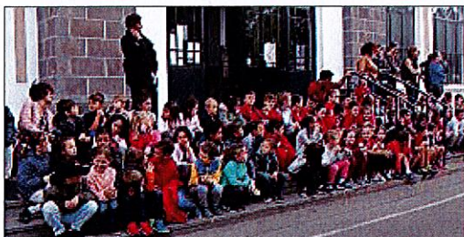
RASSEMBLEMENT. Les élèves se sont retrouvés devant la halle en fin de matinée pour une démonstration de matériel et un pique-nique zéro déchet.