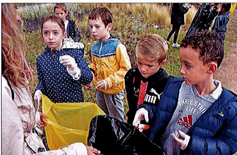
ÉDUCATION. Accompagnés de leurs enseignants, les jeunes Riomais ont pu en apprendre un peu plus sur le tri sélectif.

Hier matin, les écoles René-Cassin, Jean-Rostand, Maurice-Genest et Notre-Dame des Arts Sacré-Cœur (l'école Pierre-Brossette n'a pas pu répondre à l'invitation étant déjà impliquée