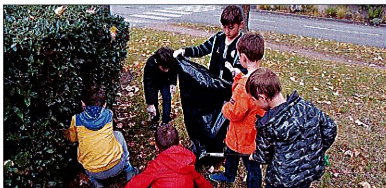
PERFECTIONNEMENT. La mission de nettoyer les rues leur a été confiée et ils n'ont rien laissé au hasard. Allant même jusqu'à débroussailler les débris dans les bosquets présents sur leur chemin vers le centre-ville.

Résultat : plusieurs sacs poubelle remplis, une bonne action pour la planète et le sentiment du devoir accompli. Bref, une matinée profitable à tout le monde. ■