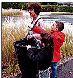
TRI. Le tout-venant dans le sac noir, le recyclable dans le jaune.