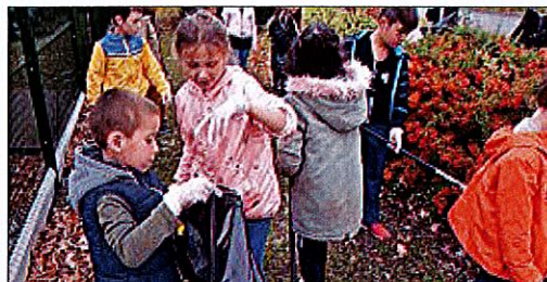
MOTIVATION. Même si parfois les débris, les répugnaient un peu, les enfants n'ont jamais renoncé à les mettre dans les sacs poubelle.

Plus d'une centaine d'écoliers a parcouru les rues de Riom hier, pour ramasser des débris dans le cadre de la deuxième édition de l'opération ville propre réservée aux scolaires.