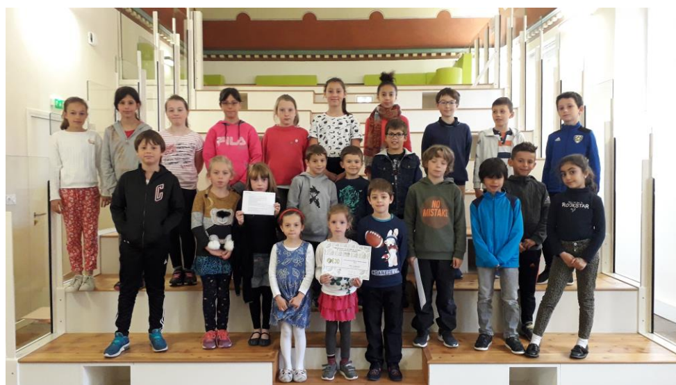
Les délégués d'élèves avec le diplôme Label E3D niveau 2.