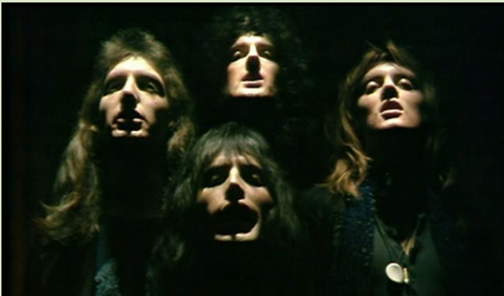
Extrait du clip video Bohemian Rhapsody de Queen