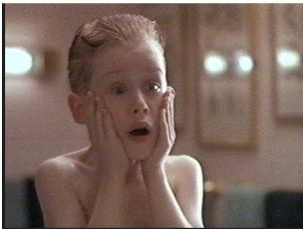
Kevin seul à la maison

L'histoire est celle d'un garçon qui s'appelle Kevin. Ses parents partent en avion et Kevin reste tout seul. Ils l'ont oublié à la maison du coup Kevin fait tout ce qu'il veut. Un soir il y a des cambrioleurs dans sa maison alors Kevin fait des pièges, et quand les cambrioleurs arrivent il se cache. C'est un film drôle, les cambrioleurs sont rigolos ils m'ont beaucoup fait rire. Kevin aussi me fait beaucoup rire avec ses pièges il y a eu un deuxième film : " Maman j'ai encore raté l'avion ".